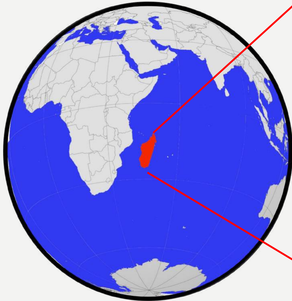
Le Royaume de Madagascar en 1895